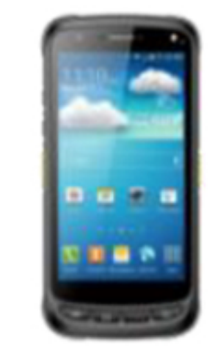
EVO 3.5 Pure